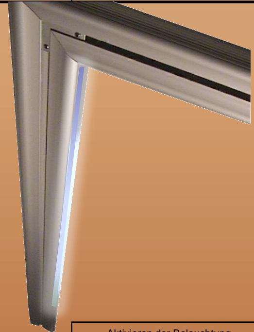
Aktivieren der Beleuchtung