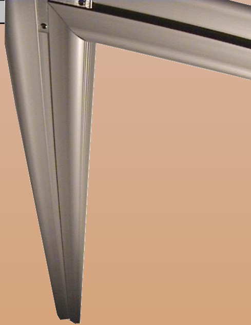
Aluprofil in der ursprünglichen Ausführung