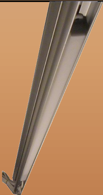
Einsetzen der Lichtkathode