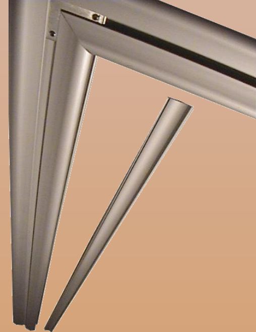
Entfernen der Alublende